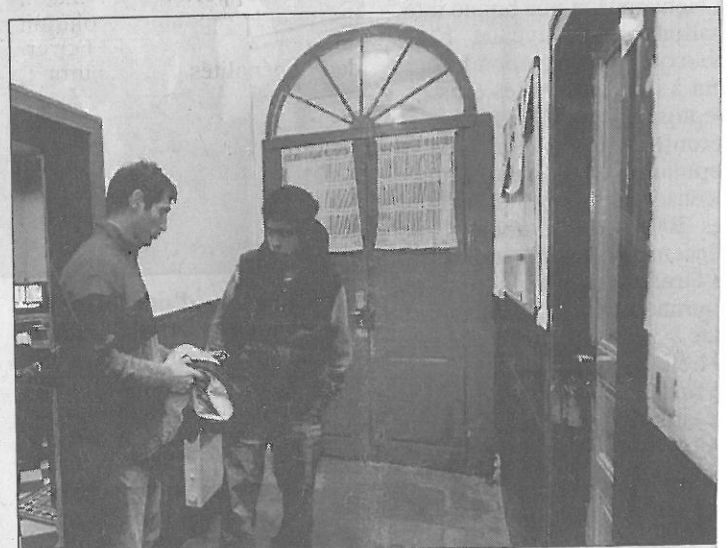
La Maison de l'amitié propose des vêtements pour les plus démunis.